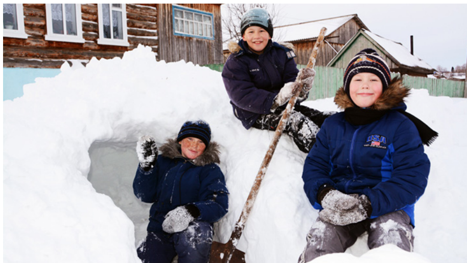
В селе Максимово ребята не сидят целыми днями за компьютером. «Свежий воздух, много снега, друзья – самое то!» - хором говорят они.