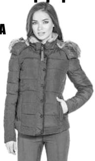
Реклама. ИП Жданова

30 января с 8.00 до 16.00 в МКДЦ ВНИМАНИЕ! ГРАНДИОЗНАЯ ВЫСТАВКА-ПРОДАЖА ЗИМНЕЙ ВЕРХНЕЙ ОДЕЖДЫ: куртки женские, пальто, куртки мужские и подростковые. Цена — 1000 руб. А также лыжные костюмы, детские комбинезоны и многое другое. Скидка — от 40 до 70%. Наша цель — низкая цена в регионе. Спешите! Количество товара ограничено.